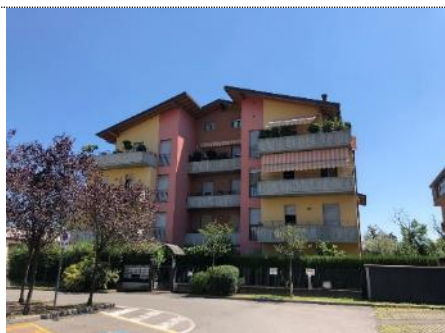
1. Vista esterna