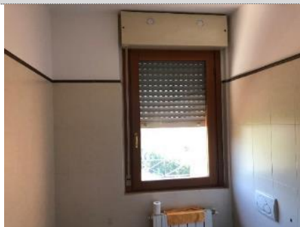
8. Bagno: posizione finestra difforme