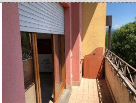
10. Balcone: asola tecnica difforme