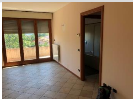
3. Ufficio: posizione porta disimpegno difforme