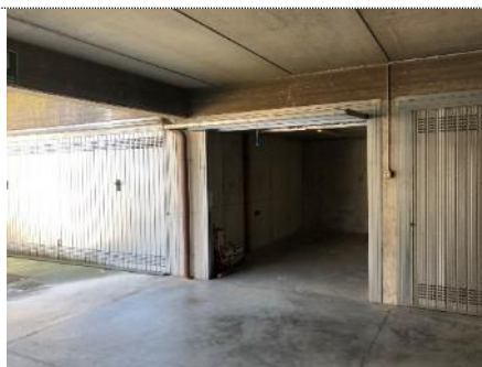
2. Vista autorimessa sub.36