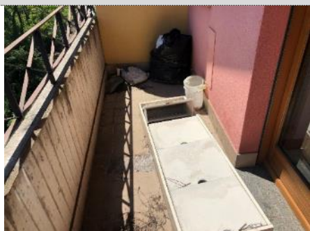
9. Balcone: rifiuti da rimuovere